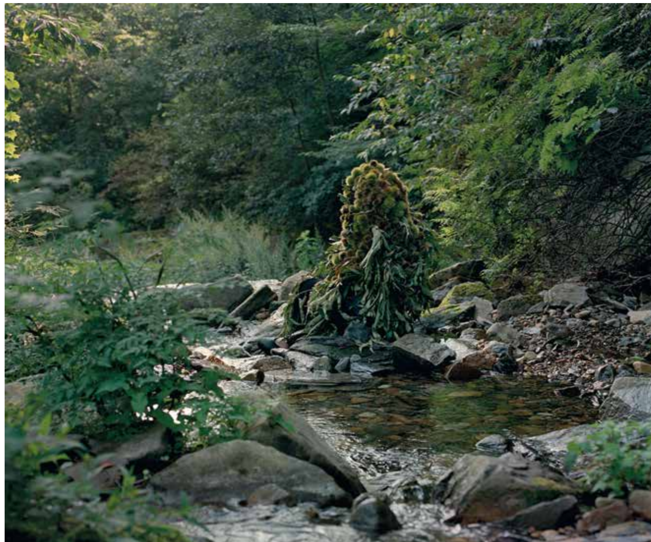
Ci-dessous. Jina - Corée du Sud, 2016.