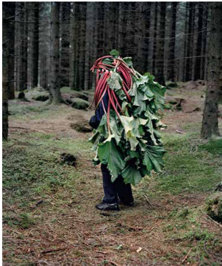
Ci-contre. Astrid - Norvège, 2011.